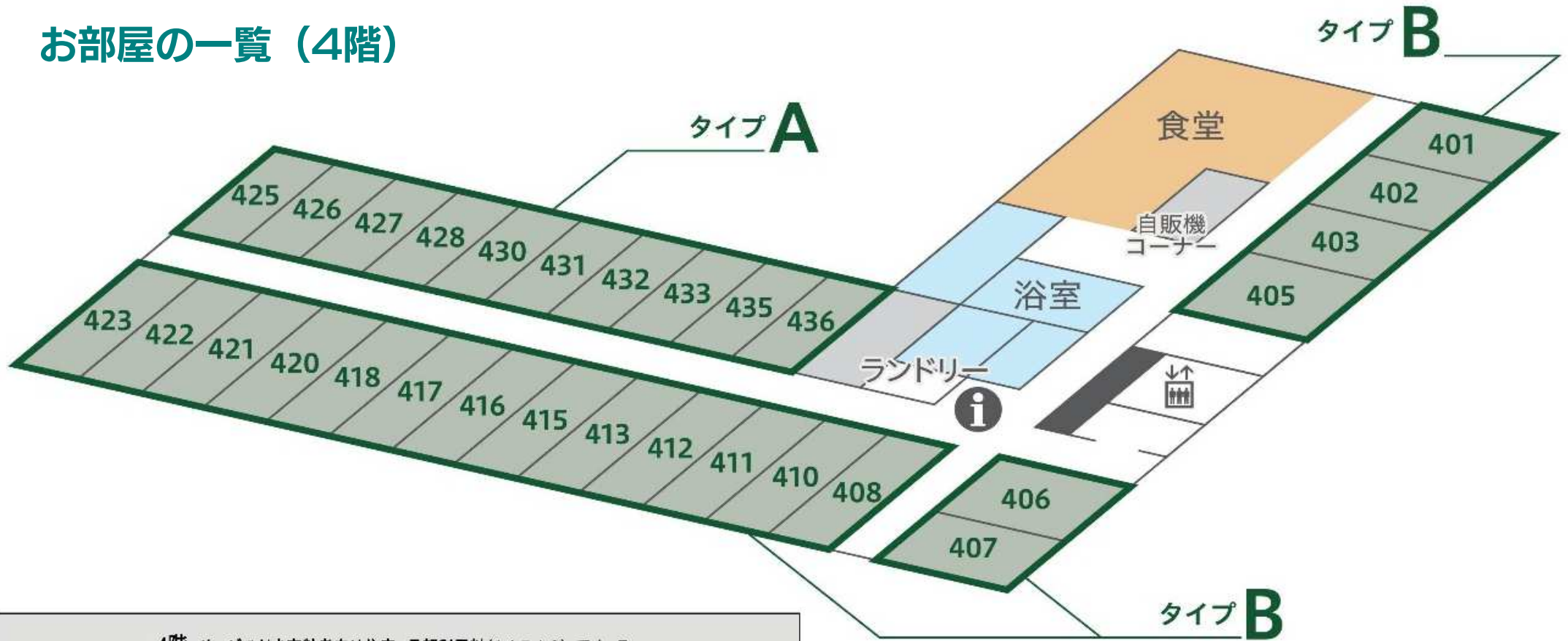
4階 サービス付き高齢者向け住宅 月額利用料(A+B+C)・アメニティ