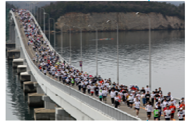
大橋を渡るランナーの様子

走り終えて ...とっても疲れた。まさか5km走れるとは思わなかった！！来年もまた頑張りたい！！